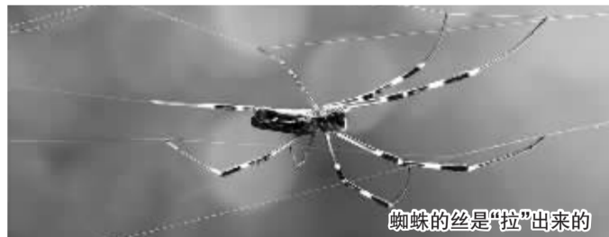
蜘蛛的丝是“拉”出来的

“吐”出来的,而是“拉”出来的!有小伙伴或许会疑惑:蛛丝源自蜘蛛的腹部,拉丝还可以理解,可蚕丝却是从蚕宝宝的嘴里出来的,难道也是拉出来的吗?答案是肯定的。研究发现,蚕丝的成分、结构与蛛丝很相似,产生过程也十分雷同,例如,当一只蚕宝宝准备“作茧自缚”时,它便会从口中分泌丝液粘到物体上,随后就开始摇头晃脑地拉丝,渐渐织出一个蚕茧。